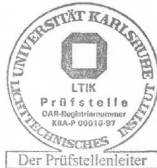
i.V.(Dr. D. Kooß)

Gegen die Erteilung der beantragten Erweiterung zu der ECE-Genehmigung bestehen von hier aus keine Bedenken.